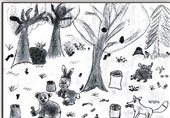
Ukážka z ich knihy "Príbehy z lesa"

Liška Janka dostala chuť na kuracie mäso. Rozhodla sa, že svoj plán uskutoční večer. Len čo mesiacik vyšiel nad bloky, liška Janka sa podíchu blížila k farme. Podhrabe sa pod ploš a ide ku kuriniam. Na jar zku cíti chuť kuracinky. Liška Janka si všimne postorenie dvere kurinai. Poľichu vylezie po schodoch a uší vidí svoju večeru. Zrazu si ju všimne kohút a nahikriká, "Hikrikikí!" Ušom okamihom vylehne farmár Guločka von z domu. Uškákku kuriniam Liška Janka zazrie farmára s palicou v ruke. Ledovo uskočila, ako sa po nej zablbnala. Uškákku kuriniam ani sa len mešočí. Vo svojej nore si ľahne hladná spať. Zostala bez večere, ale zachránila si svoj život.