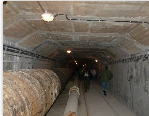
V podzemí priehradného múru