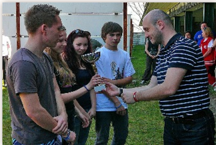
1. miesto a putovný pohár v obvodnej súťaži mladých zdravotníkov