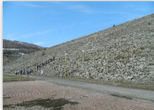
Priehradný múr a náš výstup po takmer 300 schodoch

Ako prvú sme navštívili VN Málinec. Po krátkom príhovore jedného z pracovníkov, ktorí nám vysvetlil prečo a ako bola nádrž vybudovaná, sme sa so sprievodcom dostali na miesta, kam sa bežný návštevník len tak nedostane. Zostúpili sme po niekoľko sto schodoch do priehradného múru. Nachádzali sme sa v tzv. injekčnej chodbe, ktorá sa nachádzala dokonca pod úrovňou hrádze. Miestami to vyzeralo ako v jaskyni, dokonca zo stropu viseli malé kvaple. V podzemí sme sa dostali na miesta, kde sa voda upravovala na pitnú, pretože z tejto nádrže je zásobovaná veľká časť okresov Poltár a Lučenec. Tiež sme sa dostali tesne pod vodnú elektrárňu, či k obrovským výpustovým potrubiam, kde sme pre hluk nepočuli ani vlastné myšlienky. Keď sme vyšli z podzemia, museli sme sa vyštvárať na vrch hrádze, pretože tam nás čakal autobus. Podľa odhadov sme zdolali 250 až 300