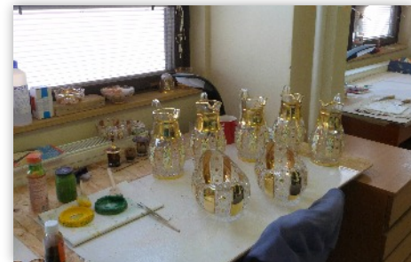
Hotové výrobky pripravené potešiť oči kupúcich

schodov, ktoré dali viacerým slušne zabráť. Nakoniec sme po krátkej desiatovej prestávke zamierili do Poltára.