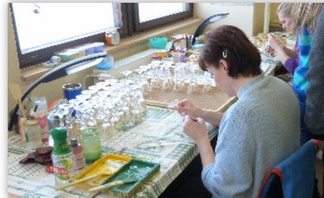
Maľovanie skla vyžaduje presnú ruku