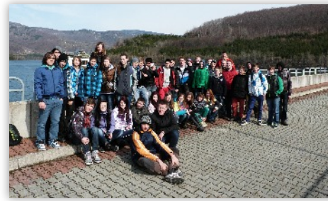
Všetci účastníci exkurzie