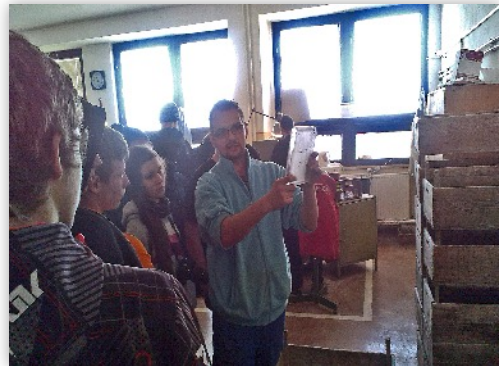
Príprava polotovaru na spracovanie